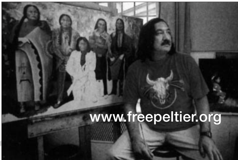
Der Maler: Leonard Peltier vor einem seiner Gemälde.

Bei einem Schusswechsel im Reservat zwischen FBI und AIM-Mitgliedern wurden zwei FBI-Beamte und ein indianischer Aktivist getötet. Während der Tod des indianischen Aktivisten niemals untersucht wurde, wurden vier Indianer wegen des Todes der Agenten verhaftet. Da einer