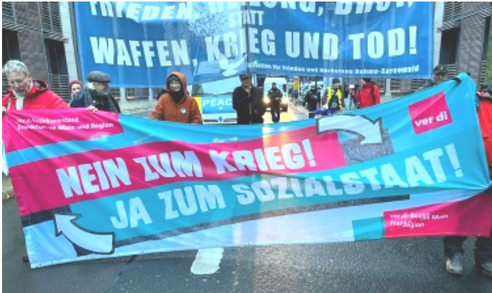
(Gewerkschaft & Friedensdemo.)

Zeitung der DKP-Darmstadt-Dieburg-Bergstraße